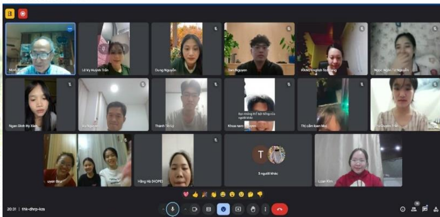
Hình các em nhận được học bổng trong một buổi gặp mặt và thư cảm ơn từ một em sinh viên.