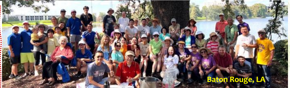
Baton Rouge, LA

“Khi chúng ta đến với Đấng Christ, chúng ta không còn là người quan trọng nhất trên thế giới đối với chúng ta nữa; Đấng Christ là người quan trọng nhất. Thay vì chỉ sống cho chính mình, chúng ta có một mục tiêu cao hơn: sống cho Chúa Giê-su.” - Billy Graham