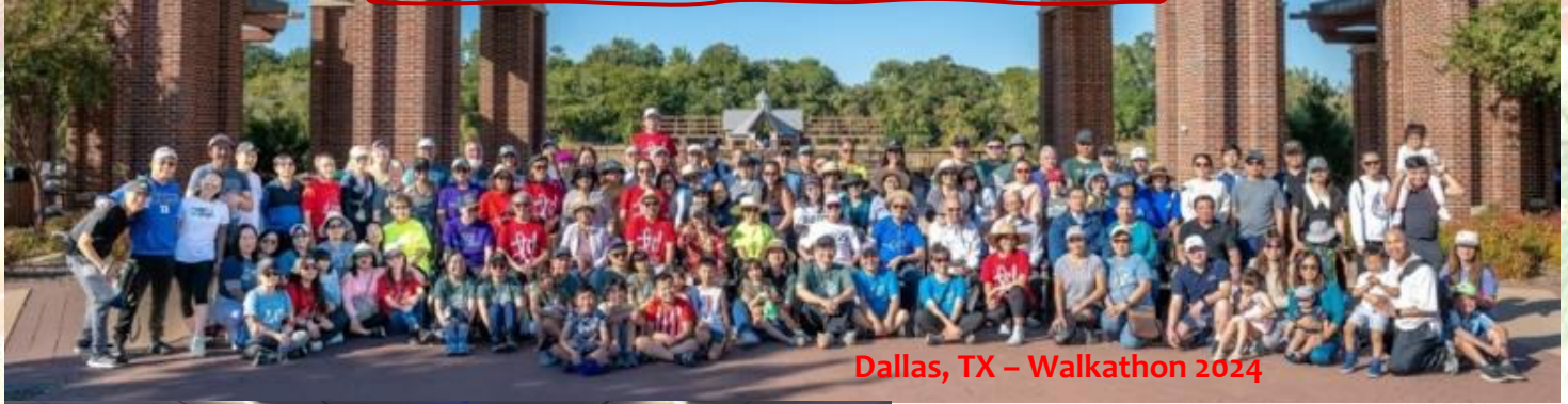
Dallas, TX – Walkathon 2024