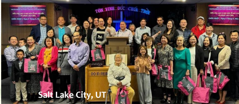
Salt Lake City, UT

“Vậy anh em hãy trở nên kẻ bắt chước Đức Chúa Trời như con cái rất yêu dấu của Ngài; hãy bước đi trong sự yêu thương, cũng như Đấng Christ đã yêu thương anh em, và vì chúng ta phó chính mình Ngài cho Đức Chúa Trời làm của dâng và của tế lễ, như một thức hương có mùi thơm.” – Ê-phê-sô 5:1-2