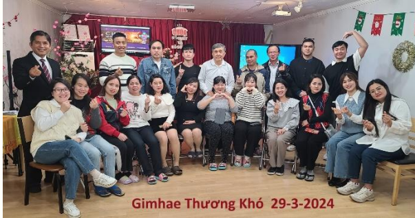
Gimhae Thương Khó 29-3-2024

Tạ ơn Chúa cho Hội Thánh Gimhae nhóm lại vui vẻ! Các bạn yêu thương nhau và có trách nhiệm lo cho công việc Nhà Chúa nhiều hơn. Lễ Thương Khó vào tháng 3, 2024 được đầy ơn Chúa!