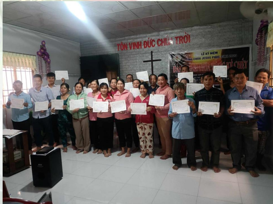
Các học viên lớp Cuộc Đời Chúa Cứu Thế được cấp giấy chứng nhận đã học xong quyển một.