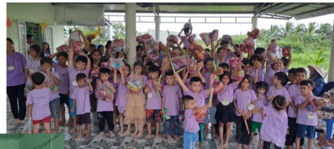
Hội Thánh Báp-tít Truyền Giáo Suối Bắc Thánh Kinh Hè ngày 17/07/2023. Chủ Đề: Chúa Giê-su Yêu Em