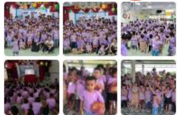
Hình ảnh Thánh Kinh Mùa Hè 21/7/2023 của Hội Thánh Cây Giang