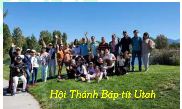
Hội Thánh Báp-tít Utah

Kính chúc toàn thể quý vị một mùa Giáng Sinh vui thỏa, phước hạnh trong ơn lành của Chúa Giê-su, và một Năm Mới bình an, tràn đầy yêu thương! - VMB