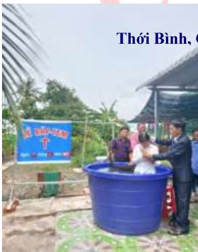
Thới Bình, Cà Mau