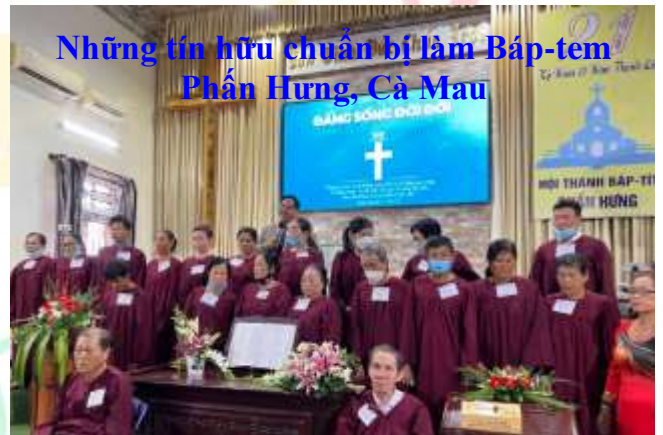
Những tín hữu chuẩn bị làm Báp-tem Phấn Hưng, Cà Mau