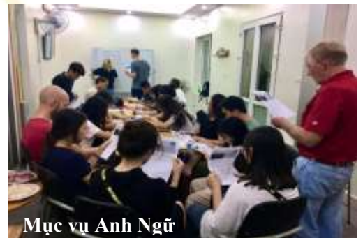
Mục vụ Anh Ngữ

Để thúc đẩy công tác truyền giáo hiệu quả, Hội Thánh đã mở ra nhiều mục vụ như: Anh Ngữ, thể thao, Good News coffee, thanh niên và sinh viên để làm công cụ kết nối, xây dựng mối quan hệ với thân hữu và chia sẻ Phúc Âm cho họ qua cá nhân chứng đạo, qua các các trang mạng như facebook, zalo..., qua