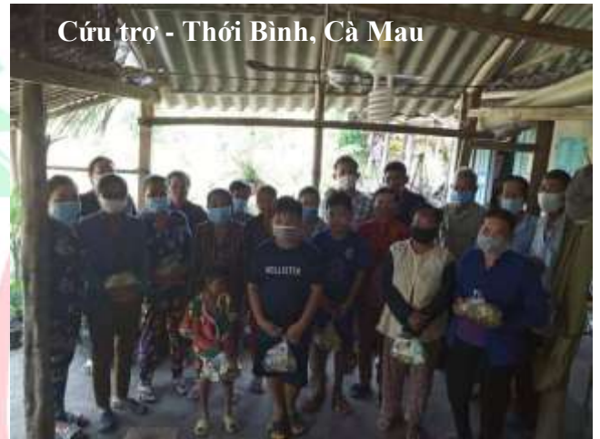
Cứu trợ - Thới Bình, Cà Mau