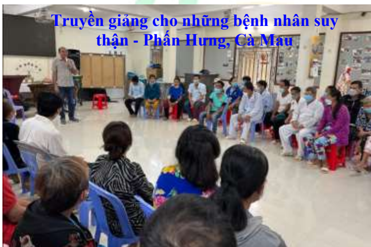
Truyền giảng cho những bệnh nhân suy thận - Phấn Hưng, Cà Mau

“Hãy đi khắp thế gian, giảng Tin Lành cho mọi người. Ai tin và chịu phép báp-tem, sẽ được rồi; nhưng ai chẳng tin, sẽ bị đoán phạt.” Mác 16:15-16