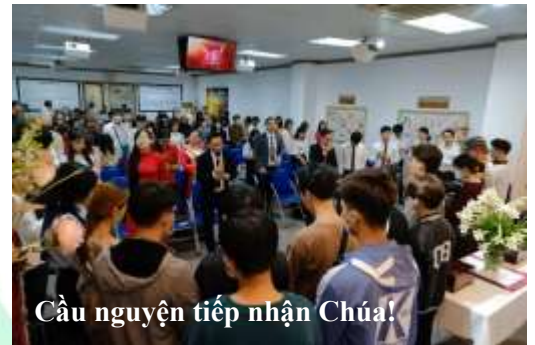
Cầu nguyện tiếp nhận Chúa!

Vâng theo Lời Chúa Chúa Giê-xu dạy với phương châm kính Chúa yêu người. Hội thánh Báp-tít Sứ Mệnh đã có cơ hội cộng tác với các quý đây tớ con cái Chúa ở nhiều nơi bày tỏ tình yêu của Chúa qua hành động cụ thể: giúp đỡ cho hàng nghìn cá nhân và gia đình gặp khó khăn, thiếu thốn do bệnh dịch Covid và do thiên tai,