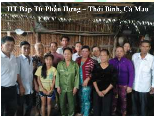
HT Báp Tít Phần Hưng – Thới Bình, Cà Mau

Cảm tạ Chúa đã cho Team VMB Việt Nam được thành lập và có sự gắn kết với các Hội Thánh địa phương trong những năm qua.