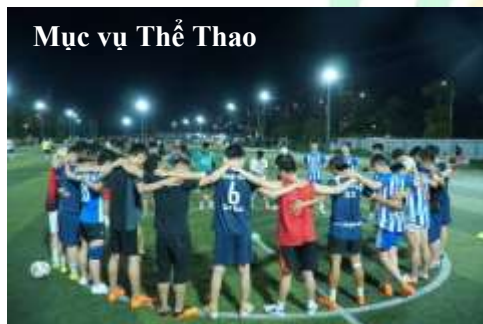
Mục vụ Thể Thao

các sự kiện và chương trình của Hội Thánh. Bởi ân điển của Chúa, qua sự giúp đỡ và cầu thay của quý đầy tớ con cái Chúa ở khắp mọi nơi. Chúa trong năm qua có hơn 2000 người được nghe biết